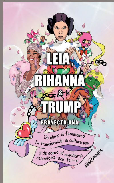
Imagen CON sangre